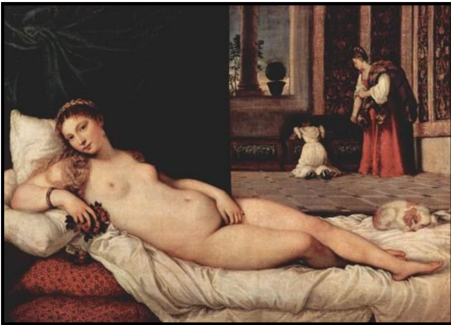
La Vénus d'Urbain par Le Titien