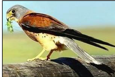
Doc.1 : Fiche d'identité du faucon crécerellette