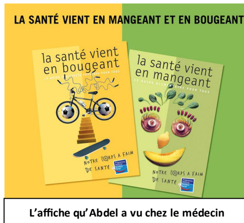
L'affiche qu'Abdel a vu chez le médecin

Etape 3 : Utilise ton analyse de chacun des documents pour rédigier un texte qui répond précisément à la consigne (utilise des chiffres pour justifier tes réponses).